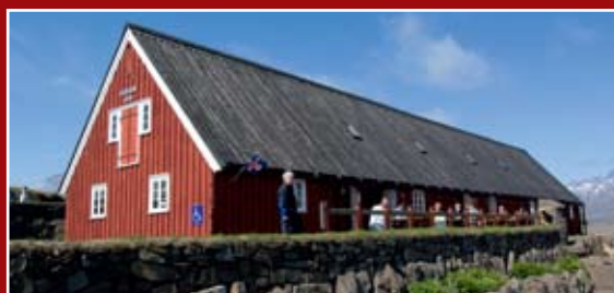
Langabúð á Djúpavogi/Museum at Langabúð